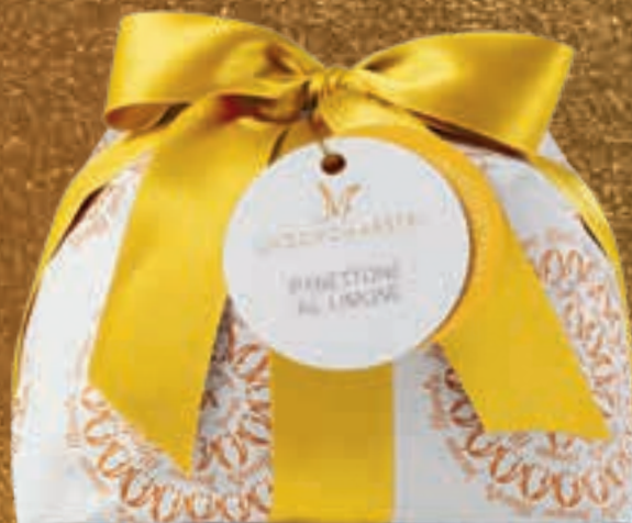
PROPOSTA 7I Panettone al limone - kg 1