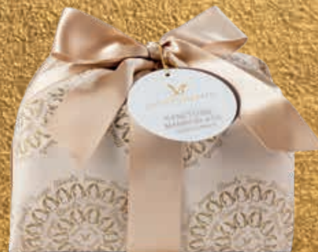
PROPOSTA 7M Panettone mandorlato senza canditi - kg 1