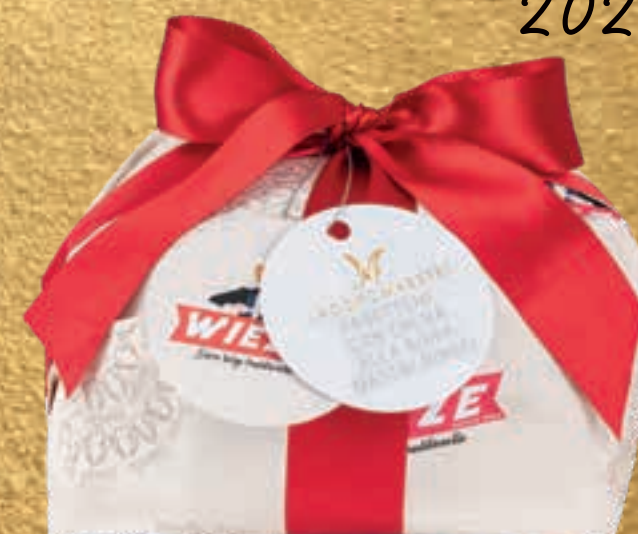
PROPOSTA 7H Panettone con crema alla birra Mastri Birrai - kg 1