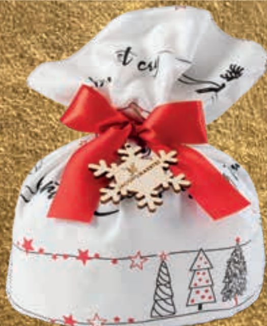
PROPOSTA 7F Panettone classico Deluxe - kg 1