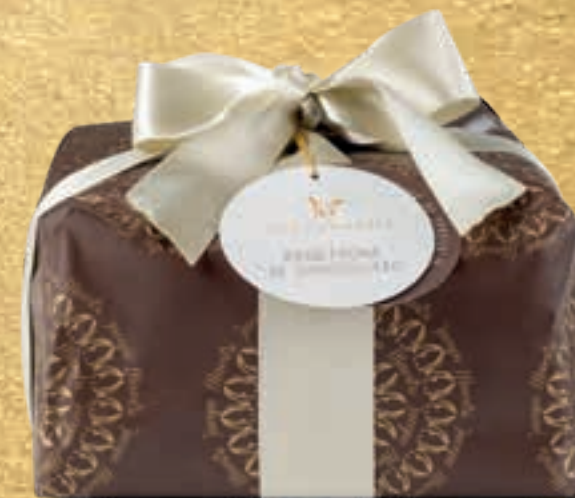
PROPOSTA 7D Panettone al cioccolato - kg 1,1