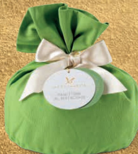
PROPOSTA 7G Panettone al pistacchio - kg 1