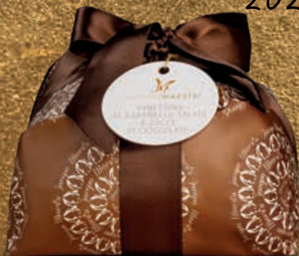
PROPOSTA 7E Panettone al caramello salato e gocce di cioccolato - kg 1