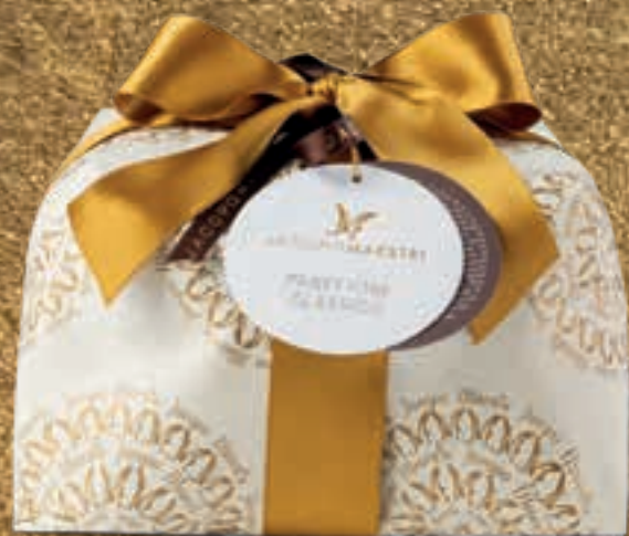
PROPOSTA 7A Panettone classico - kg 1