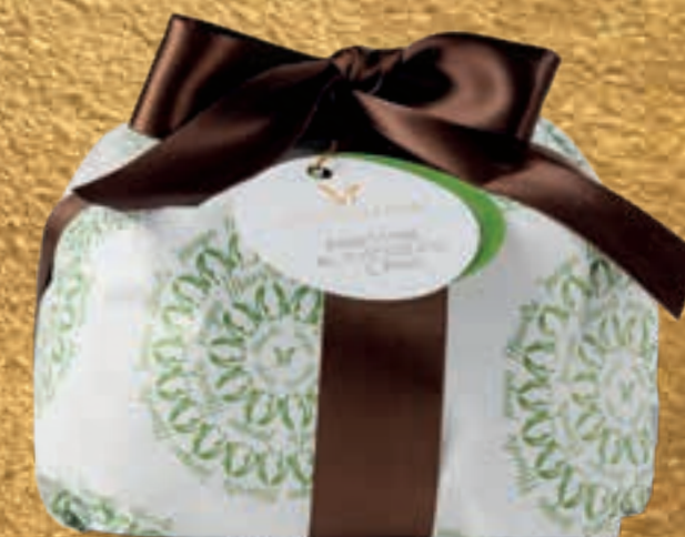
PROPOSTA 7N Panettone al cioccolato e pera - kg 1