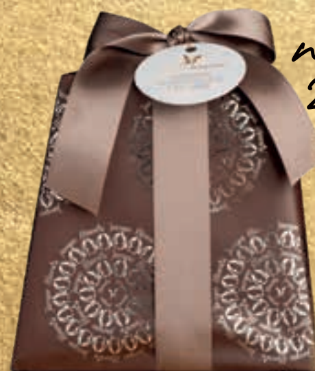
PROPOSTA 7C Pandoro al cioccolato São Tomé - g 900