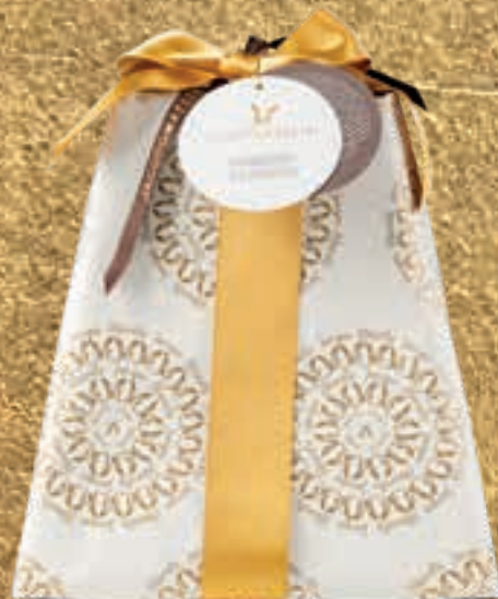
PROPOSTA 7B Pandoro classico - kg 1