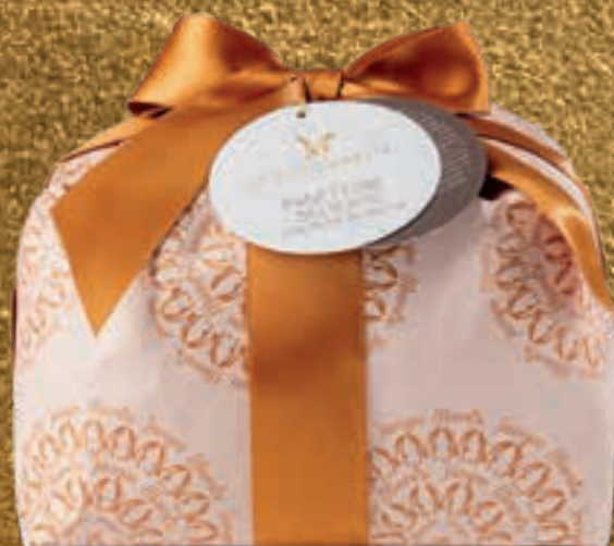
PROPOSTA 7L Panettone delicato con pezzi di frutta - kg 1